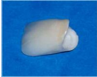
Direct Composite 前面 贴面: RM550-600/牙

美观，颜色及通透程度接近真牙颜色 牙渍不容易沉积 质地较脆弱，容易碎裂 需要一定厚度，因此要把牙齿磨去多一些(两层)， 可能须要打麻药。 应用:可用作瓷贴面或瓷人造牙冠 适用于前面的牙齿，因为前牙在美观方面的要求较高 Targis/Vectris纤维超瓷(Polymer):>RM850 EMPRESSII全铸瓷(CastedFullPorcelain):>RM950 Alumina:RM1050-1600 Porcera:>RM1800-2500 (5 years gradual warranty by the manufacturer. T & C apply)