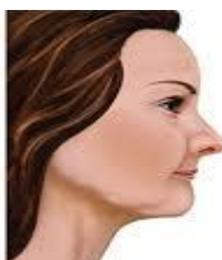
after tooth loss