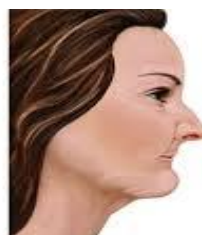
after bone loss

Kos: RM400-800 (tulang +- Membran) Sila rancangan penambahan tulang sebelum cabutan.