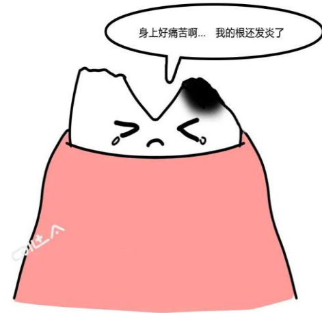
身上好痛苦啊... 我的根还发炎了