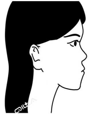
不经意的侧脸就像一盆冷水，瞬间浇灭了别人的好感。